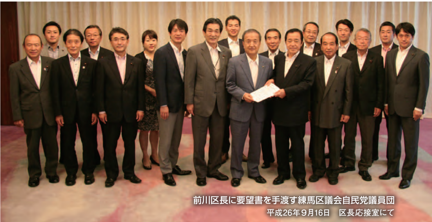
前川区長に要望書を手渡す練馬区議会自民党議員団 平成26年9月16日 区長応接室にて

平成二十七年 度 予 算 お よ び 各 事 業 に 対 す る 要 望 書 を 区 長 に 手 渡 す !